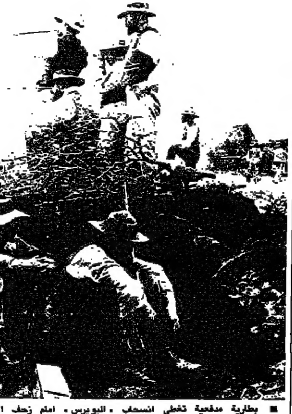
مظلية سفعية تحضى انسحاب البويرس، امام زحف الانكليز المظفرين

كثفت كالت الريفيقا الجنوبية قبل اعصار الفصل العنصري. ثمة صور تحمل على تسويقها وكلفة سيغما الفرنسية، وهي تعود إلى ما بين ١٩٠٠ و ١٩٢٩، وتظهر مشاهد من نهاية حرب البويرس، وتقول المطوعين الفرنسيين الحاربة الانكليز. وهناك لقطات من اولى مراحل العمل في مناجم الذهب. تذكر ان البويرس ليسوا الا المستوطنين الهولنديين الذين سرخوا ومروا قبل وصول الانكليز الذين كانوا يارعبين في مطلع القرن، اي موسم الذهب الاستعمارية فلانسرو عليهم. ووضعوا ايديهم على ثروات الذهب الهائلة واشتريت منطقة ترانسفال، بشكل خاص في سيد الذهب وتوسيعه. والمؤرخون يقولون ان العام ١٩٢٩ كان بداية الاندورادو. اي موسم الذهب والابويرس وزرع الانكليز تجهيزات هي عبارة عن بلى تحميه متعامة، خصوصا منهم سفوح الهولنديين الذين كانوا يداينين في ثمت حياتهم. وعاشوا تحت المضارب الجلدية. ولم يستطعوا استخراج الذهب. بل اكتفوا بالحياة القلقة على زراعة الارض. كانهم لقلوا جزءا من البلاد الواطئة معهم إلى جنوب افريقيا المكتظة بالاحتلالات. لكن الانكليز الذين فتحوا مناجم الذهب، فتحوا ايضا مناجم الحديد لانهم سارعوا الى زرع عمالهم البيض في كل مناطق السود حيث لاحت الثروة الفضاضة واعلمهم تصفروا في جنوب افريقيا كما تصفروا في فلسطين، حيث كان وعد بلفور البداية الاحتفالية لزراعة اليهود الاوروبيين على حساب السكان الاصليين. ان اسرائيل هي المراد لنظام الفصل العنصري.